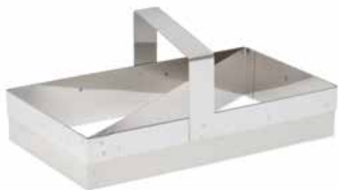
02038 Croissant uitsteekvorm rvs 21 cm - 8 1/4" Découpoir croissant inox Croissant Ausstecher Edelstahl Croissant cutter s/s