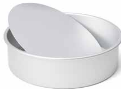
08960 Taartvorm met losse bodem Ø 22 cm - 8 5/8" 08961 Moule à manqué fond amovible Ø 26 cm - 10 1/4" 08962 Tortenform mit lose Boden Ø 28 cm - 11" Tart pan with removable bottom