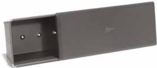
02939 Casinobroodvorm met deksel 20 cm - 7 7/8" Moule à pain avec couvercle de mie Toastbrot-Backform mit Deckel Pullman loaf pan with lid