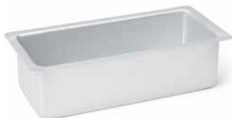
08901 Cakevorm 25 cm - 9 7/8" Moule à cake Königs-kuchenform Loaf pan