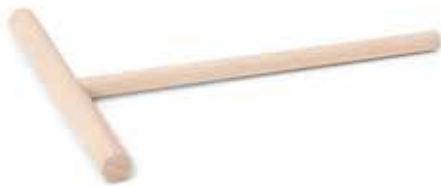
93397 Crêpe-verdeler 16 cm - 6 1/4" Diviseur de crêpe Kreppteiler Crepe divider