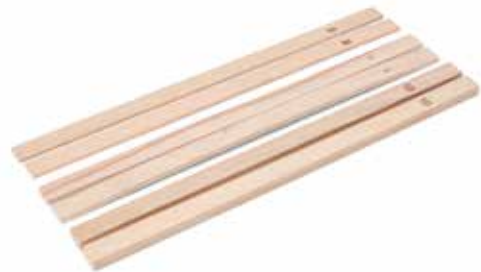
02255 Set latjes om deeg uit te rollen 6 dlg. Lot de 6 règles à pâtisserie Ausroll-Hölzer 6 tlg. 6 piece dough rods set