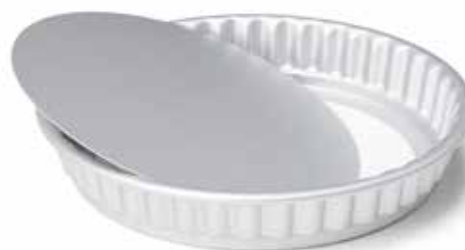
08948 Quichevorm met losse bodem Ø 26 cm - 11" Moule à tarte fond amovible Quicheform mit lose Boden Quiche pan with removable bottom