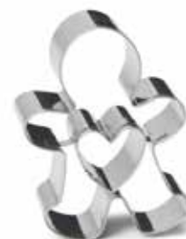
01989 Uitsteekvorm rvs speculaaspop 7 cm - 2 3/4" Emporte-pièce inox manele Ausstechform Edelstahl Lebkuchenmann Cookie cutter s/s gingerbread man