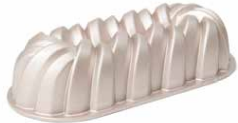
04503 Tulbandvorm gietaluminium 31 cm - 12 1/4" Moule à kougelhopf fonte d'aluminium Napfkuchenform Alu-Guss Bundt pan cast aluminum