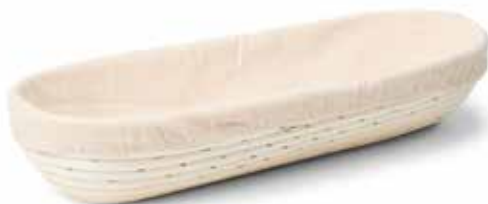
92035 Rijsmand met deegkleed 28 x 13 cm - 11 x 5 1/8" 92040 Panier en osier avec toile à pâte 41 x 15 cm - 16 1/8 x 5 7/8" Gärkorb mit Teigtuch Proofing basket with dough cloth