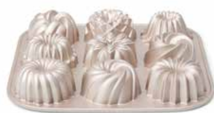
04521 Mini tulbandvorm gietaluminium 9 vaks 24 cm - 9 1/2" Moule mini kougelhopf fonte d'aluminium 9 cavités Mini-Napfkuchenform Alu-Guss 9 tlg. Mini bundt pan cast aluminum 9 cup