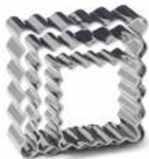
02036 Set uitsteekvormen rvs vierkant 3 dlg. Lot de 3 emporte-pièces inox carré Ausstechformen-Set Edelstahl Quadrat 3 tlg. 3 piece s/s square cookie cutter set