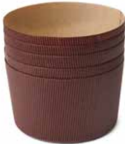
01855 Papieren panettone vormen 5 stuks Ø 13 cm - 5 1/8" 01856 Caïssette à panettone en papier 5 pièces Ø 16 cm - 6 1/4" Panettone-Papierförmchen 5 Stück Paper panettone cases 5 pcs