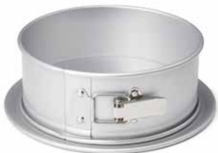
08923 Springvorm Ø 22 cm - 8 5/8" 08924 Moule à charnière Ø 24 cm - 9 1/2" 08925 Springform Ø 26 cm - 10 1/4" Springform pan