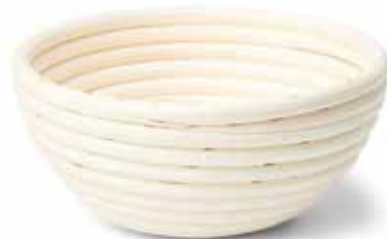
92020 Rijsmand Ø 20 cm - 7 7/8" Panier en osier Gärkorb Proofing basket