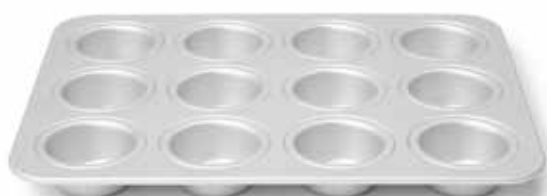
08934 Muffinvorm 12 vaks 35 cm - 13 3/4" Moule à muffins 12 cavités Muffin-Backblech 12 tlg. Muffin pan 12 cup