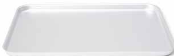
08939 Bakplaat 42 x 30 cm - 14 5/8 x 10 5/8" Plaque à pâtisserie Backblech Jelly roll pan