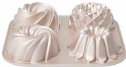
04520 Mini tulbandvorm gietaluminium 4 vaks 24 cm - 9 1/2" Moule mini kougelhopf fonte d'aluminium 4 cavités Mini-Napfkuchenform Alu-Guss 4 tlg. Mini bundt pan cast aluminum 4 cup