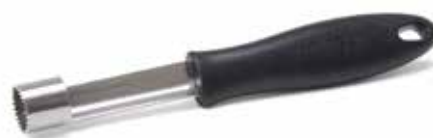
10378 Apelboor rvs 20 cm - 7 7/8" Vide-pomme inox Apfelentkerner Edelstahl Apple corer s/s