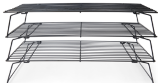
01325 Taartrooster antikleef 3 etages 40 x 25 cm - 15 3/4 x 9 7/8" Grille à pâtisserie antiadhésif 3 niveaux Tortenkühler antihaf 3 Etagen Cooling rack non-stick 3 levels