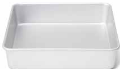
08922 Vierkantvorm 20 cm - 7 7/8" Moule carré Quadrat-Backform Square cake pan