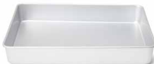
08932 Bak- en braadslede 33 x 24 cm - 13 x 9 1/2" Plat à rôtir Back- und Auflaufform Bake and roast pan