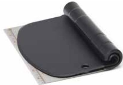
01537 Set deegschrapers 2 dlg. 15 x 11 cm - 5 7/8 x 4 3/8" Set de 2 cornes à pâtisserie Teigschaber-Set 2 tlg. 2 piece pastry scraper set