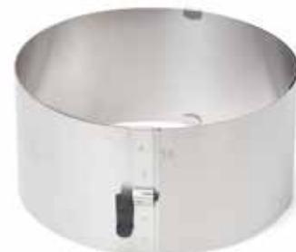
02457 Taartring verstelbaar rvs met vergrendeling 17 - 30 cm Cercle à biscuit extensible inox avec levier de blocage 6 3/4 x 11 3/4" Tortenring verstellbar Edelstahl mit Klemmhebel Adjustable cake ring s/s with lock