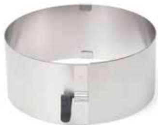
02458 Taartring verstelbaar rvs met vergrendeling 17 - 30 cm Cercle à biscuit extensible inox avec levier de blocage 6 3/4 x 11 3/4" Tortenring verstellbar Edelstahl mit Klemmhebel Adjustable cake ring s/s with lock