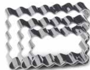
02037 Set uitsteekvormen rvs rechthoekig 3 dlg. Lot de 3 emporte-pièces inox rectangle Ausstechformen-Set Edelstahl Rechteck 3 tlg. 3 piece s/s rectangle cookie cutter set