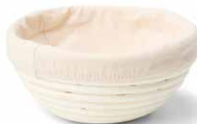
92045 Rijsmand met deegkleed Ø 20 cm - 7 7/8" 92050 Panier en osier avec toile à pâte Ø 25 cm - 9 7/8" Gärkorb mit Teigtuch Proofing basket with dough cloth