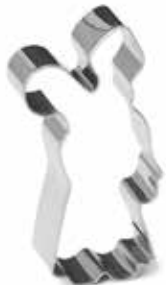
01973 Uitsteekvorm rvs Sinterklaas 10 cm - 4" Emporte-pièce inox Saint Nicolas Ausstechform Edelstahl Sankt Nikolaus Cookie cutter s/s Saint Nicholas